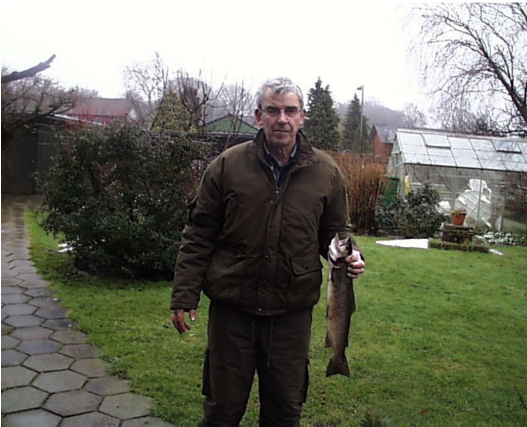
Hardy er kommet hjem med aftensmaden